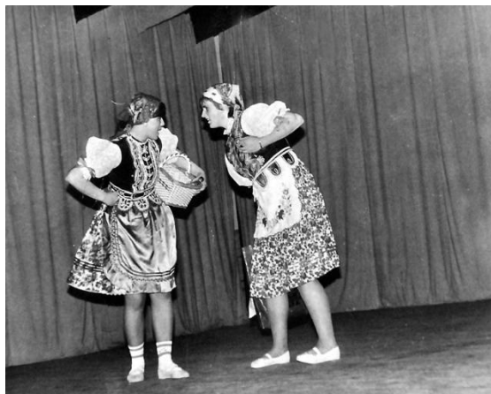
Táto fotografia pochádza zo sedemdesiatych rokov 20. storočia a zachytáva krátku divadelnú scénu, ktorú dievčatá odohrali v krojoch, tzv. napodobeninách niekdajších krojov, ktorými sa vyznačovala obec.

Výrazný odliv obyvateľstva v druhej vlne nastal hneď po vzniku I. ČSR. Dôsledkami I. svetovej vojny obyvateľstvo trpelo nedostatkom jedla, ktoré bolo na prídelové lístky. Zásobovanie tovarom viazlo, ale postupne sa aspoň uvoľnila situácia, ktorá umožňovala vycestovať a získať prácu za morom. Tretia veľká migračná vlna postihla obec v krízových 30 rokoch 20. storočia. Kocel'ovce nikdy nebola veľká dedina. V roku 1930 tu žilo len 223 obyvateľov, z čoho v krátkom čase odišlo do Ameriky 12 rodín a mnohé tam ostali natrvalo. Práve z návštevy po dlhých rokoch z USA na Slovensko pochádza táto fotografia. Tí čo zostali v obci, si vytvárali rôzne podporné a svojpomocné združenia a spolky.