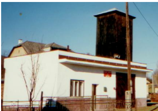
Budova požiarnej zbrojnice bola postavená v r. 1953 a rekonštruovaná v roku 1978