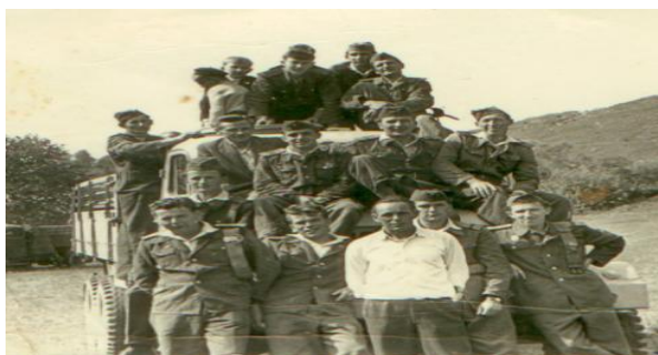
Dobrovoľný hasičský zbor z roku 1959

Dobrovoľný hasičský zbor vznikol v Kocel'ovciach v roku 1928 a na začiatku mal 20 členov. Vrchol v početnosti získal v roku 1980, keď mal 50 členov. Aktívny je dodnes, vystriedalo sa v ňom už päť generácií a zúčastňuje sa rôznych hasičských súťaží, o čom svedčí bohatá zbierka rôznych ocenení uložených v obci.