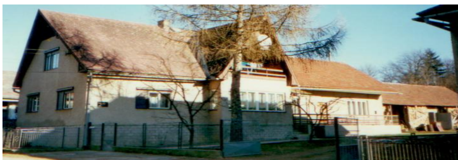
Budova novej fary