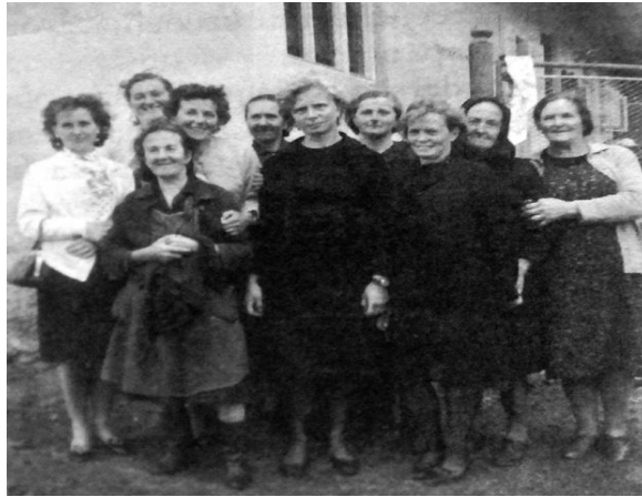
Táto fotografia vznikla pravdepodobne v 50 rokoch 20. storočia a vidíme na nej návštevu amerických migrantov v rodnej obci Kocel'ovce.