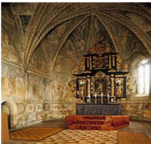
Barokový oltár pochádza z roku 1740