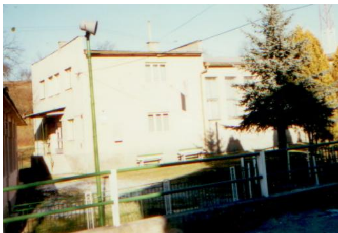
Budova Obecného úradu a Kultúrneho domu v Kocelovciach skolaudovaná v auguste 1974