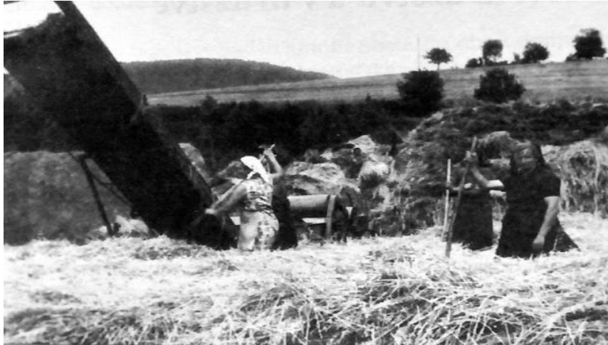
Táto fotografia pochádza zo šesťdesiatych rokov 20. storočia a vidíme na nej pracovníkov miestneho jednotného roľníckeho družstva pri zbere sena

V roku 1959 založili Kocel'ovčania JRD. Postupne sa vybuďoval hospodársky dvor na hone Za vodou pod Dúbravou. Od šesťdesiatych rokov mali aj pridruženú stavebnú výrobu. Kocel'ovčania si v družstve počínali veľmi dobre, družstvo bolo najviac prosperujúce v Štítnickej doline.