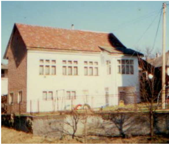
Budova Materskej školy postavená svojpomocne obyvateľmi v 60 rokoch