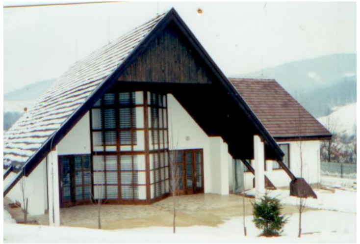
Budova Domu Smútku dokončená výstavba v roku 1998