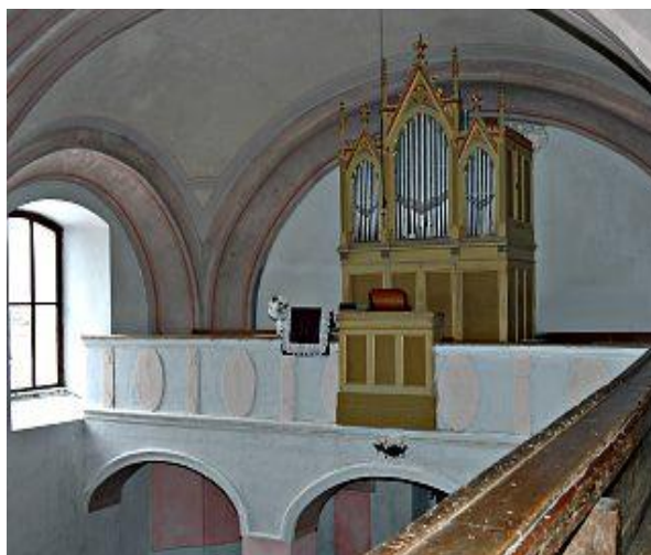
Organ z roku 1908